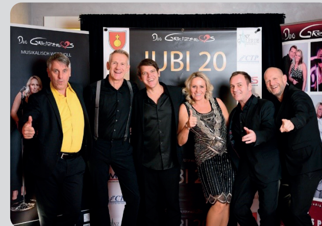
Duo Grenzenlos & Friends

Eintritt: 80,- € pro Person inkl. Wasser zzgl. sonstige Getränke*)