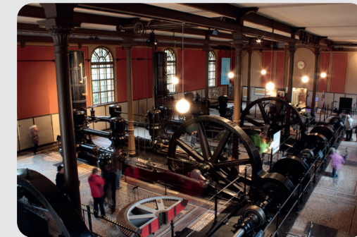
Technikdenkmal Wasserwerk am Hochablass

Online-Anmeldung ab sofort möglich unter: