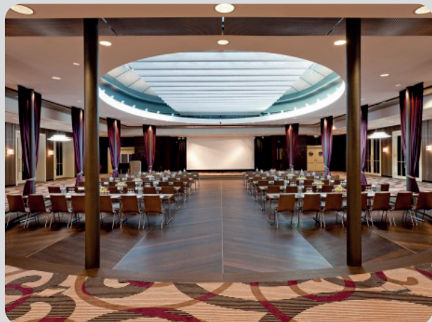
Teehalle Hotel Maximilian's